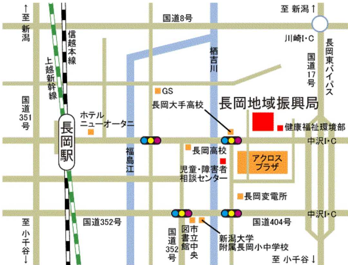
〔長岡地域振興局周辺の交通案内図〕